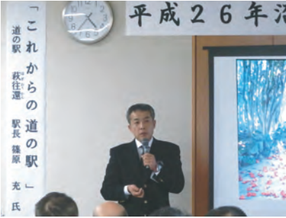
篠原氏による講演