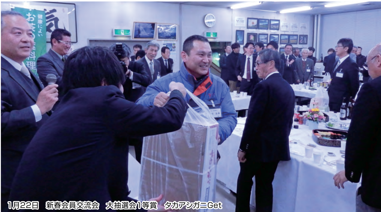
1月22日 新春会員交流会 大抽選会1等賞 タカアシガニGet