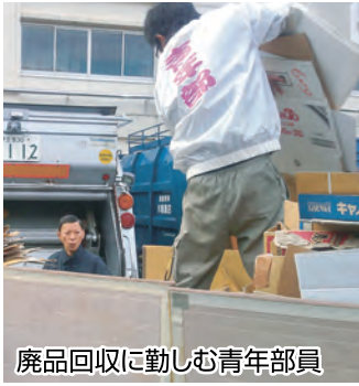
廃品回収に勤しむ青年部員